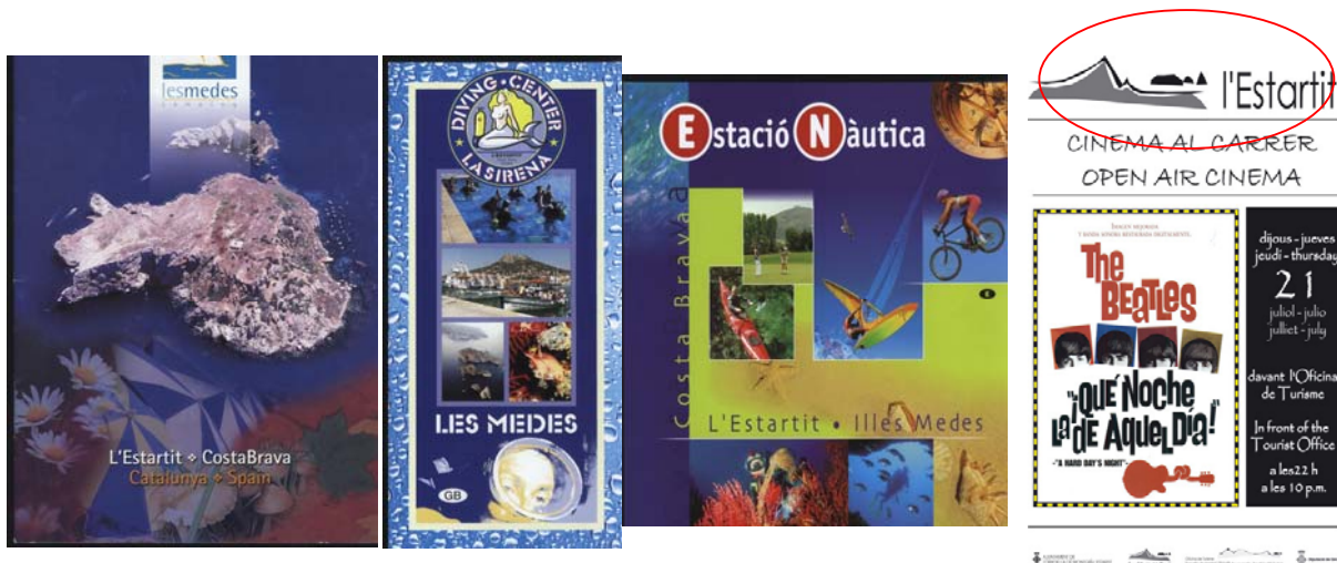
Figura 1: Distintas imágenes de las Islas Medas vinculadas a diferentes empresas

Por ejemplo, si bien durante décadas, la promoción del micro destino L´Estartit se basó en resaltar la existencia de una playa y ciertas condiciones climáticas, actualmente, todos los establecimientos turísticos (hoteles, centrales de reserva, campings , supermercados, etc.) se esfuerzan en incluir en sus campañas de promoción la imagen del archipiélago y de las actividades de turismo marino que se pueden llevar a cabo en su entorno. Las Islas Medas son el logotipo que representa incluso a la corporación municipal. La existencia del área protegida constituye el escenario y la imagen central de la oferta de actividades lúdicas de destino.