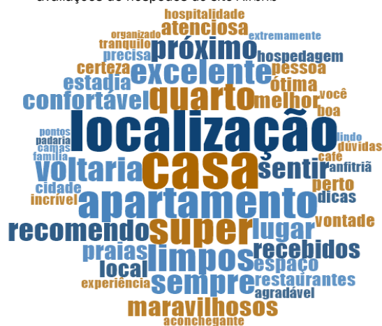
Figura 1 – Nuvem de palavras com termos frequentes em avaliações de hóspedes do site Airbnb

Por meio do software NVivo , as 210 revisões coletadas no site do Airbnb foram submetidas a uma consulta de frequência de cada termo. Posteriormente, uma lista com as 50 palavras com maior repetição de uso pelos usuários em seus relatos foi gerada e, a partir dela, uma nuvem de palavras foi gerada, na qual a posição e o tamanho dos termos variam de acordo com a respectiva frequência de aparição nos comentários dos viajantes (Figura 1). Essas palavras refletem emoções, qualidades e percepções dos hóspedes acerca de suas experiências e podem revelar significados latentes a partir de uma análise atenta ao contexto em que foram utilizadas.